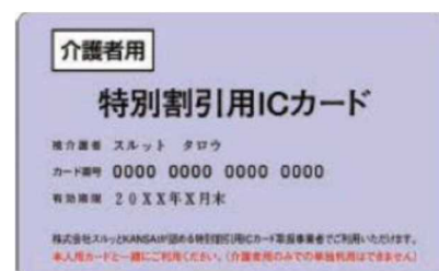
(スルッと KANSAI 特別割引用 ICカード)