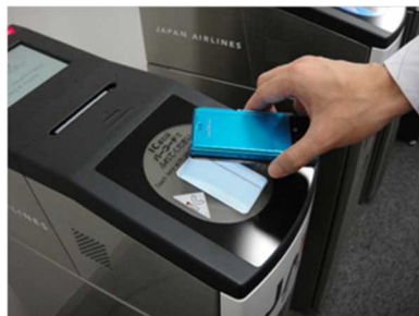
(読み取り機にタッチして登録情報を確認)

会員情報への登録により、 障害者割引の航空券をインターネットで購入した場合でも、チェックイン時に障害者手帳を提示する必要はなく、直接保安検査場へ行くことも可能。