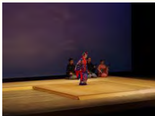
特別プログラム「琉球古典芸能鑑賞会」