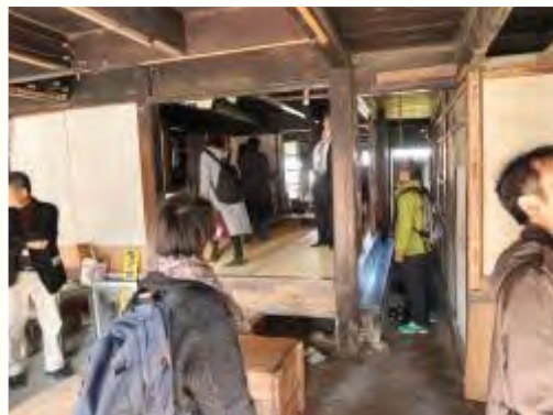
施設見学 赤レンガ商家