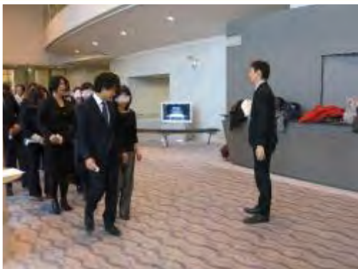
実演 視覚障害者編

障害には、視覚障害、聴覚障害、発達障害などさまざまな種別があり、特性も違うことから、基本の対応を心掛けるとともに、それぞれの障害に合った対応が必要となる。そのため、どのような特性があるのかを知ることが大変重要となるが、外からでは障害の有無や、どのような障害があるのかが分からない場合も多いので、常に注意を払う必要がある。