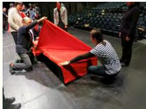
実習1 毛氈の張り方