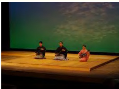
特別プログラム「琉球古典芸能鑑賞会」