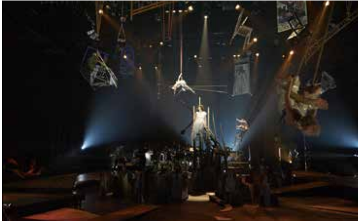
KAAT 神奈川芸術劇場プロデュース『夢の劇』（2016）