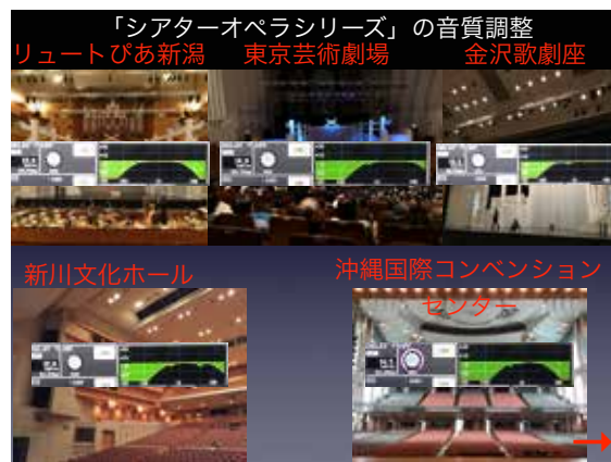
石丸氏作成の資料より