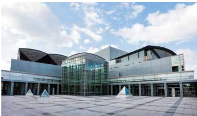
メディキット県民文化センター