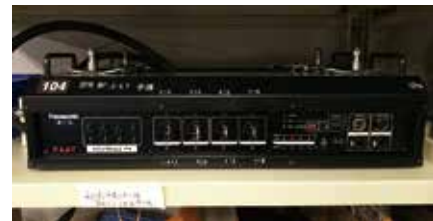
KAAT で使用している移動型（分散型）調光器